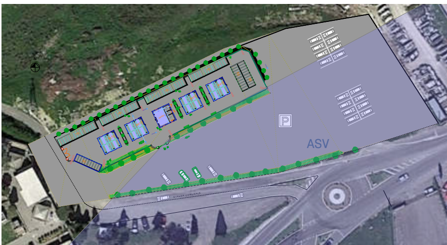
PLANIMETRIA INTERVENTO PROPOSTO scala 1:200